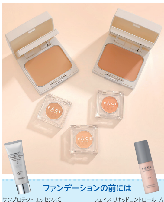
サンプロテクト エッセンスC フェイス リキッドコントロール -A-