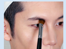
こっそり立体感 彫り深フェイス!