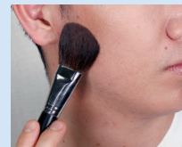
シェーディング 男らしい骨格作り!