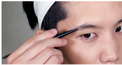
アイブロウペンシル 702(ディープグレイ) 毛が少なくまだらな方におすすめ。

しっかり毛量があるタイプの方は、ニュアンスアイブロウで毛流れを整えながらON!立体感が出て、凛々しい表情に。