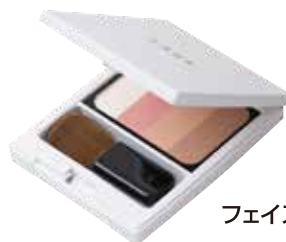
フェイス グローオンブラッシュ

グローオンブラッシュの「ブラウン」を 全体にのせて明るく 眉にもONしてアイブローメイクを楽しんで♪